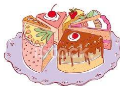
Kuchen z. Mitnehmen