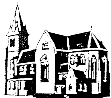
Herz Jesu Landsweiler-Reden