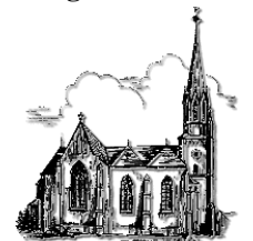
St. Martin Schiffweiler