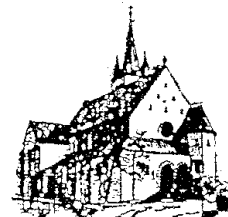
St. Barbara Stennweiler