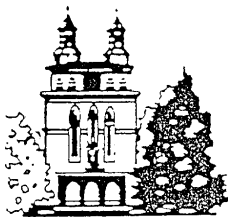
St. Laurentius Heiligenwald