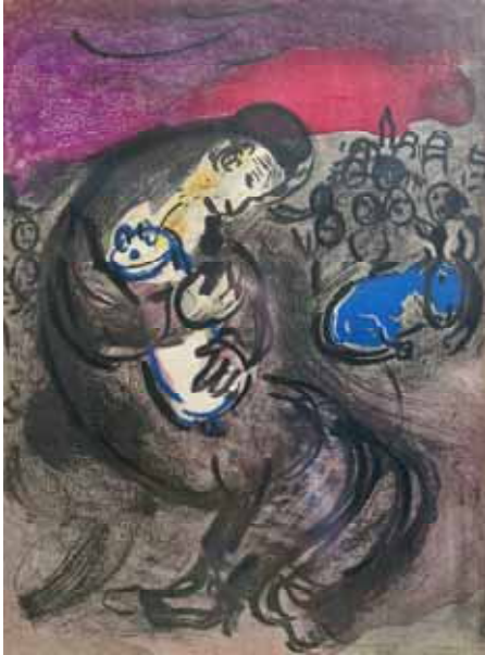
Marc Chagall: „Klagelied des Jeremia“