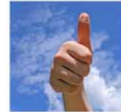
Daumen Hoch FAMILIENKIRCHE IN EILENDORF

Gemeinsam fröhlich Gott loben und sich von seiner Botschaft stärken lassen.