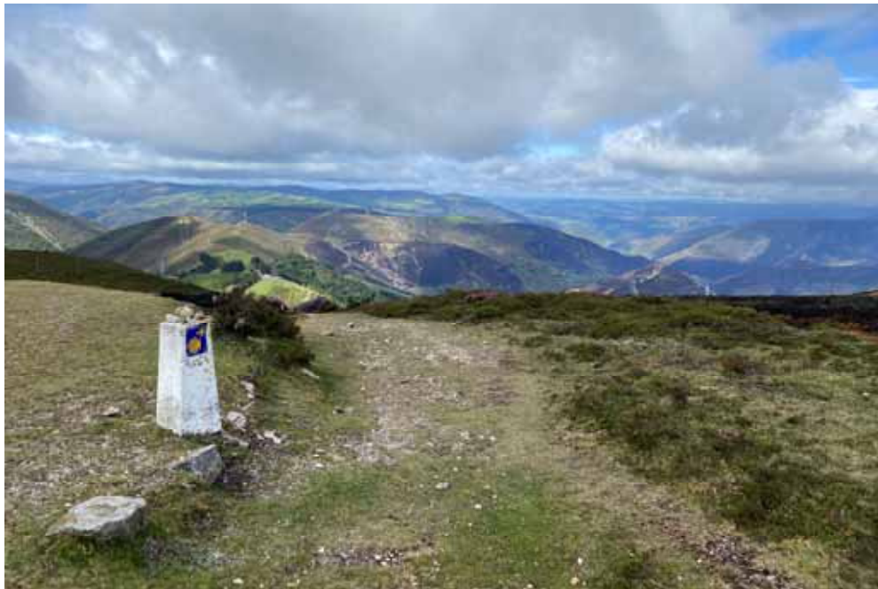
Camino Primitivo