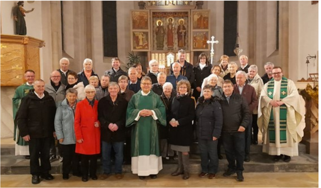
Glück- und Segenswünsche an unsere diesjährigen Jubelpaare!