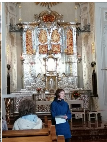
Pfarrverbandswallfahrt nach Pribram