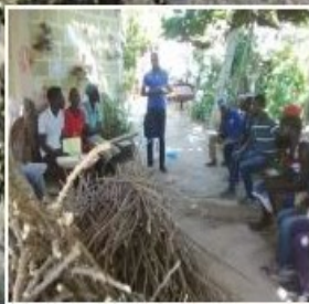
Projet agricole : Soutien continu de l'agriculture pour garantir la sécurité alimentaire