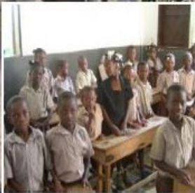
Projet Beauséjour : Sécurisation à long terme de 4 écoles et mise en place de structures organisationnelles rurales

Nous serions très reconnaissants pour toute donation sur notre compte ou via Payconiq. Des milliers de familles haïtiennes vous remercient pour votre soutien !