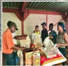
Aide d'urgence à court et moyen terme : Distribution de nourriture, semences et petits animaux à des familles défavorisées