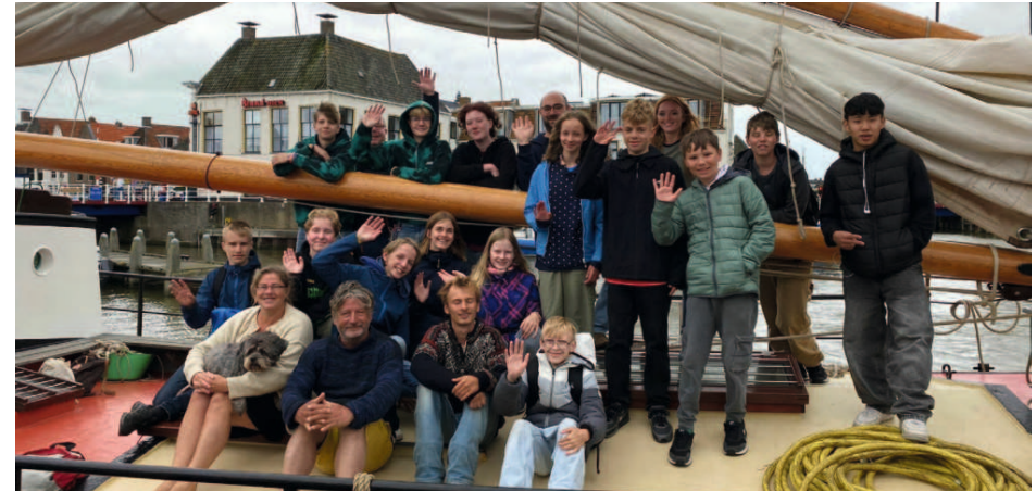
Die Teilnehmer der Segelfreizeit.

Segelfreizeit des Kirchenkreisjugenddienstes Rhaudefehn