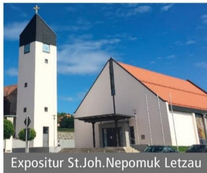
Expositur St.Joh.Nepomuk Letzau