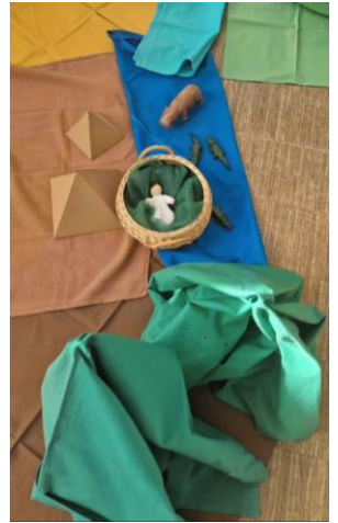
Kinderkirche vom 23. März Beginn im Pfarrheim