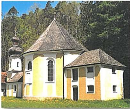
Filialkirche Fisslking, Pfarrei Ensdorf Fisslking 1, Kraiburg