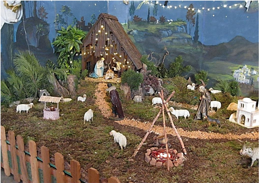
Krippe in Dannstadt St. Michael

Hochdorf-Assenheim · Mutterstadt Rödersheim-Gronau · Dannstadt-Schauernheim