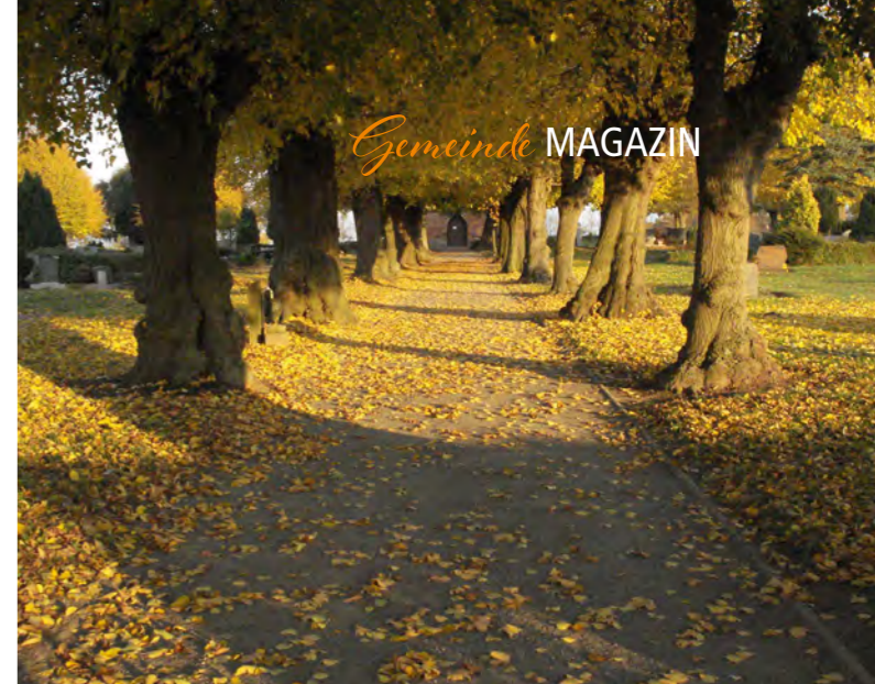
EEB Sonderförderung.