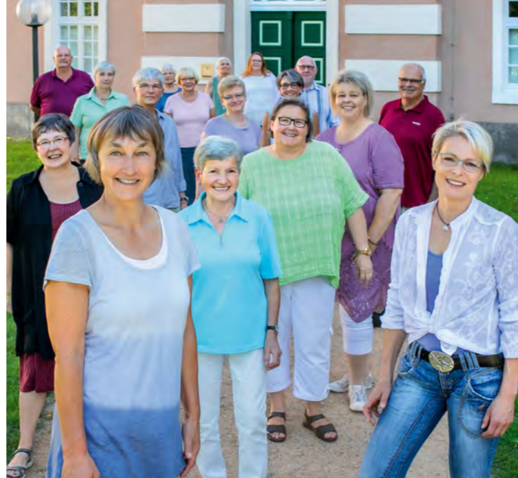
Ehrenamtliche aus 25 Jahren Hospizdienst Uelzen.