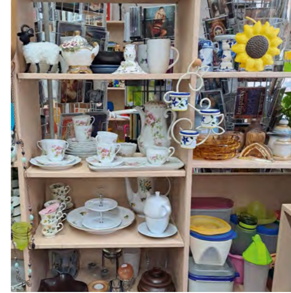
Gebrauchtes neu verwenden: im Mehrwertstübchen in Bad Bevensen gibt es viel zu entdecken.

richtung und Einzelhandel. Das liegt auch dem gesamten Team am Herzen. Sowohl füreinander als auch für ihre Kundschaft haben die Mitarbeitenden ein offenes Ohr. Gegenseitige Wertschätzung und ein freundliches Miteinander prägen das Arbeiten und Einkaufen im Mehrwertstübchen. So ist es nicht verwunderlich, dass viele Kunden immer wieder gerne kommen und einige Stammkunden sogar nahezu täglich den Laden besuchen. Denn die Begegnung auf Augenhöhe wissen sie allemal zu schätzen. Das Team des Mehrwertstübchens ist nicht nur gerne behilflich, wenn es um die Auswahl oder passende Größe bei Kleidungsstücken geht. Auch Sorgen und Nöte, aber ebenso Erfreuliches wird ihnen zugetragen. „Wir sind kein ausgebildetes Fachpersonal“, betont Frau Ahrend, „aber jedes Teammitglied hat seine Gaben und Talente, die in die Arbeit mit eingebracht werden“. Die Eine kann gut zuhören und weiß Stellen, auf die sie verweisen kann, wenn weitere Hilfe oder Unterstützung benötigt wird. Die Andere hat ein Händchen, Waren schön zu präsentieren und Fotos davon auf die