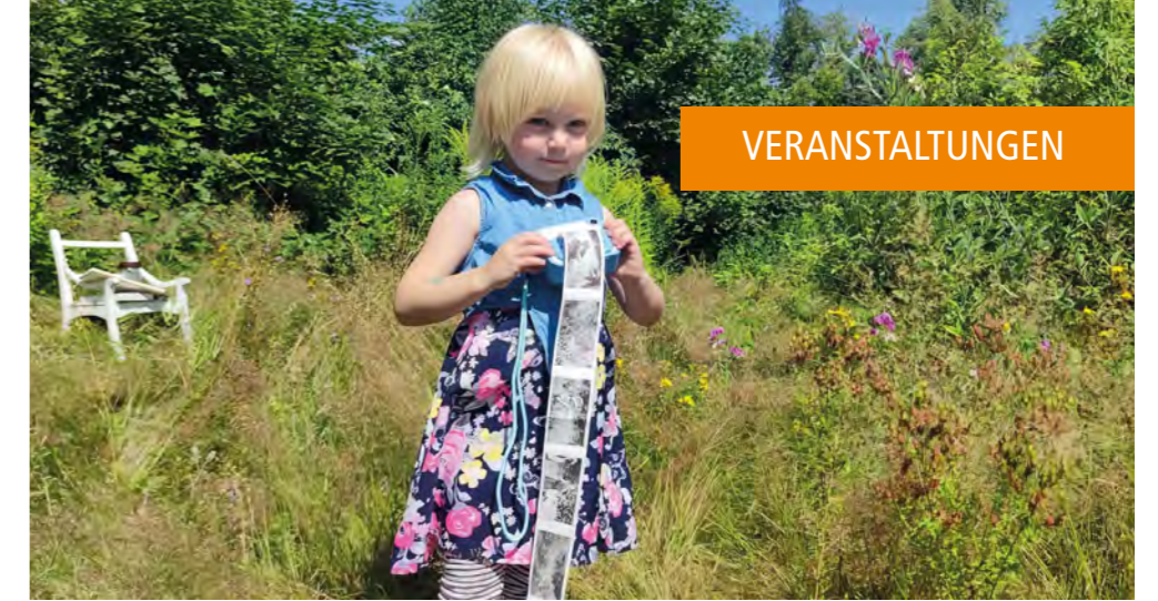
Flora im Garten der Kulturstation.