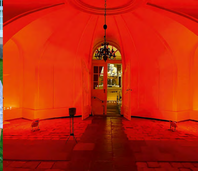
Taizé-Abend in der Klosterkirche Medingen.