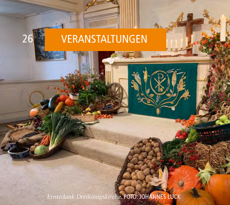
Erntedank Dreikönigskirche.