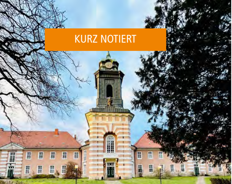
Kloster Medingen und einladende Vorhalle der Klosterkirche.