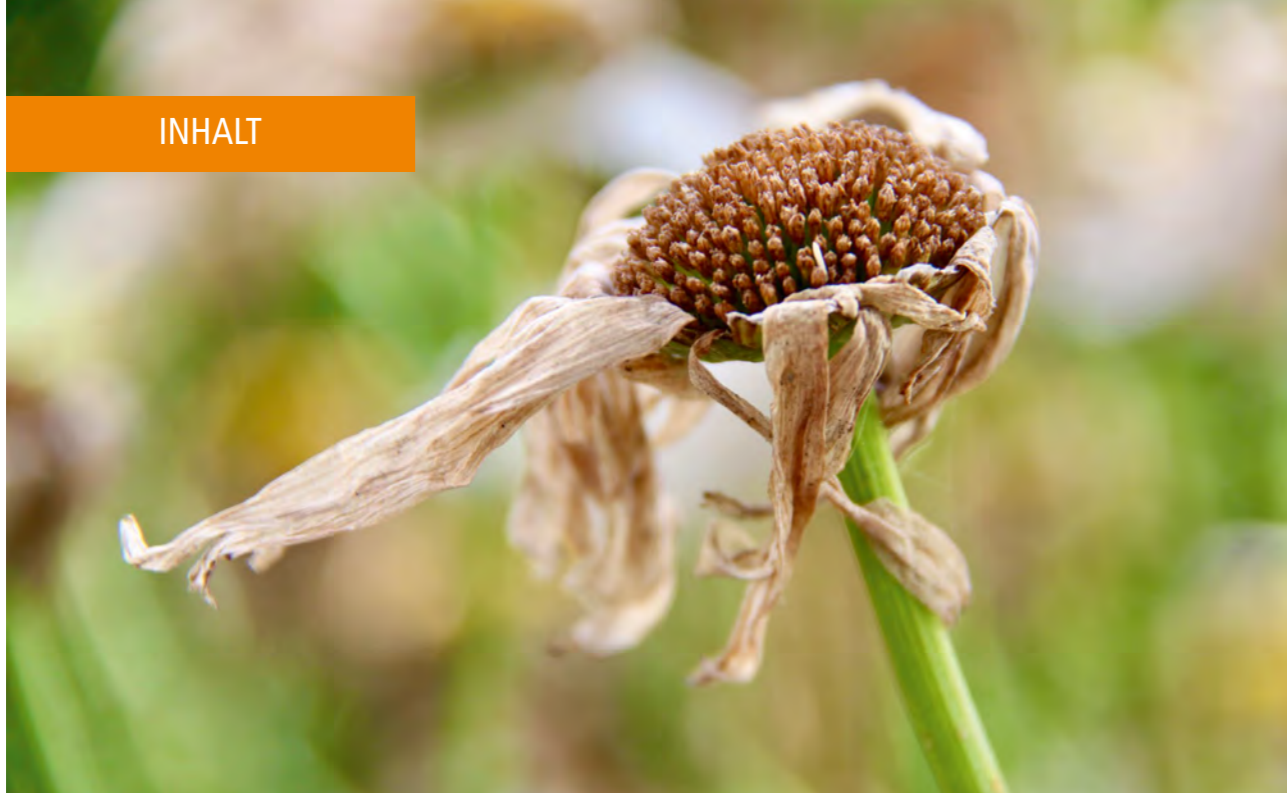
„Vergänglichkeit“ lautet der Titel der Bildstrecke von Martina Alexandra Luck bei den Gottesdiensten in dieser Ausgabe (S. 16 - 20).