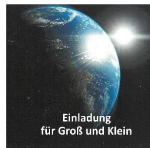
mit Bildern und Gedanken zum Thema „Himmel und Erde“