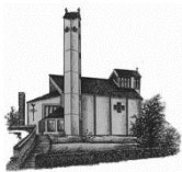
St. Martinus Trier-Zewen