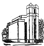
St. Simeon Trier-West