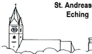
St. Andreas Eching