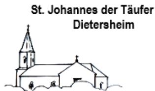
St. Johannes der Täufer Dietersheim