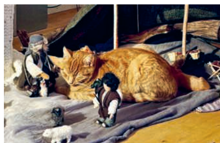
Larry als Mitglied der Krippe.