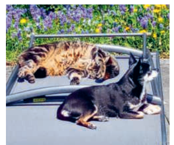
Freunde fürs Leben.