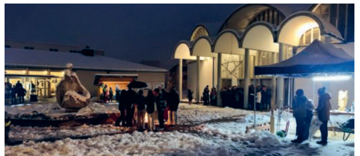
Klein, aber fein: der Adventsmärt in St. Maria.