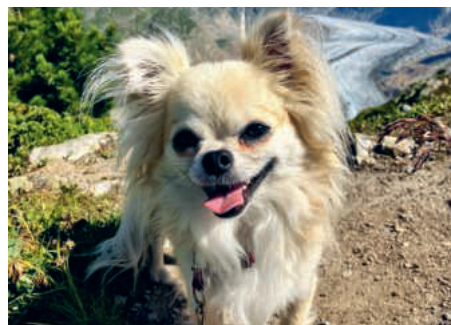
Imroy wandert gerne.