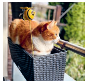
Schöne Aussicht.