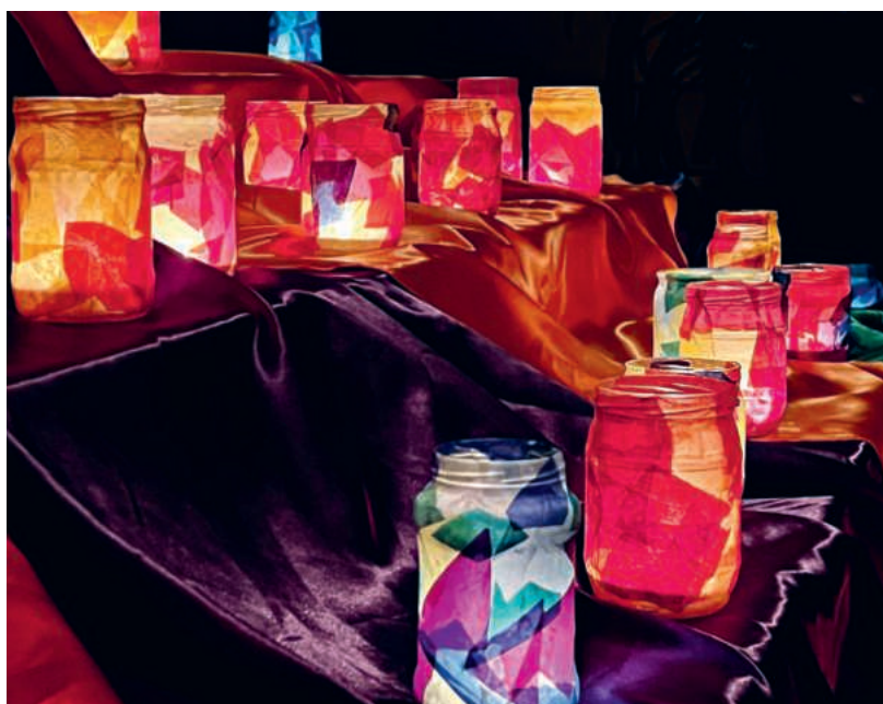
Taizé-Gebete werden im Schein zahlreicher Kerzen gefeiert.