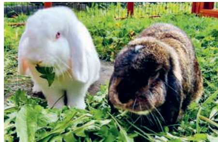
Flöckli und Stärnli futtern.

Die auf dieser Seite abgebildeten Tiere spielen alle eine grosse Rolle im Leben ihrer Menschen, unserer Mitarbeitenden. Wir danken herzlich für die eingesendeten Fotos.