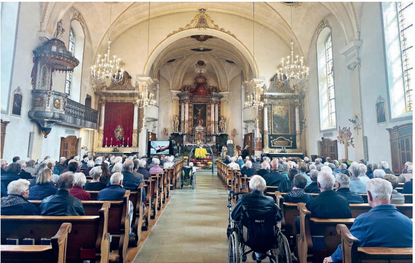
Am Hochzeitsjubiläums-Gottesdienst durften wir 84 Paare begrüßen.