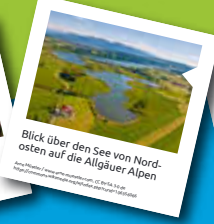
Blick über den See von Nordosten auf die Allgäuer Alpen