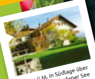
1000 m.ü.M. in Südlage über dem Niedersonthofener See im Oberallgäu