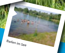
Baden im See