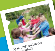
Spaß und Spiel in der Gemeinschaft