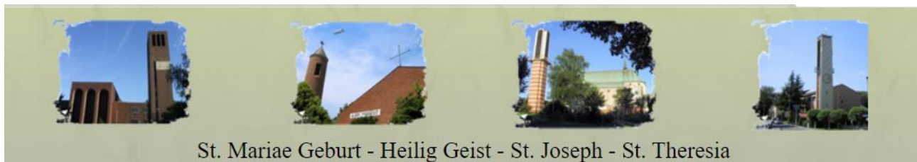
St. Mariae Geburt - Heilig Geist - St. Joseph - St. Theresia