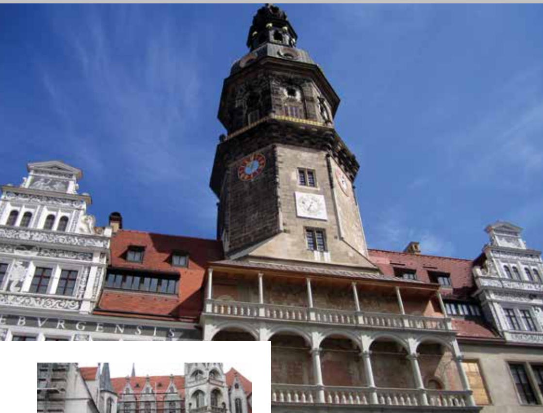
2001 - 2007 Residenzschloss Dresden