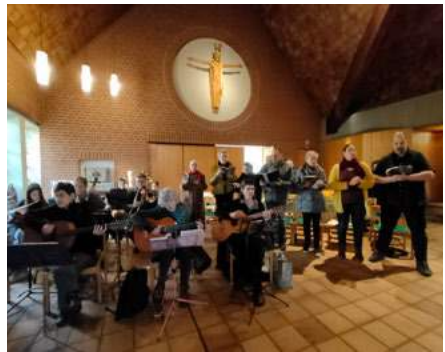
Familienmesse in Kirchweyhe im November:

Wir bitten um eine Anmeldung für den Workshop bis zum 07. Februar im Pfarrbüro Kirchweyhe.