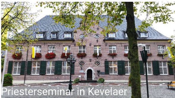
Priesterseminar in Kevelaar