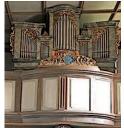
Orgeln (v.l.n.r.): Steinsfeld, Habelsee, Mörlbach und Steinach/Ens