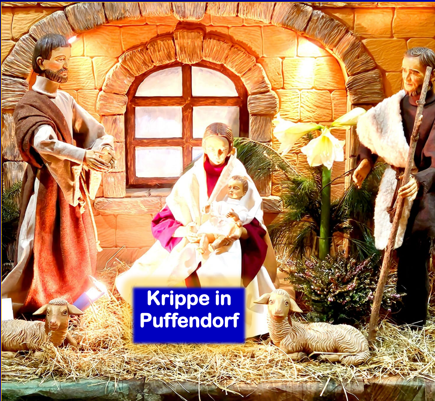
Krippe in Puffendorf

Mach mit: Lebendiger Adventskalender Seite 4