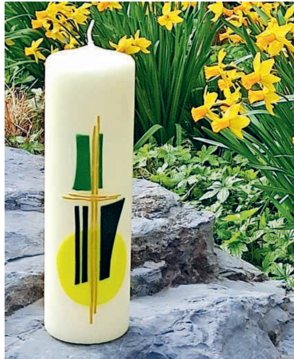
Ein herzliches Dankeschön an Anna Studhalter für die Gestaltung der Osterkerze.