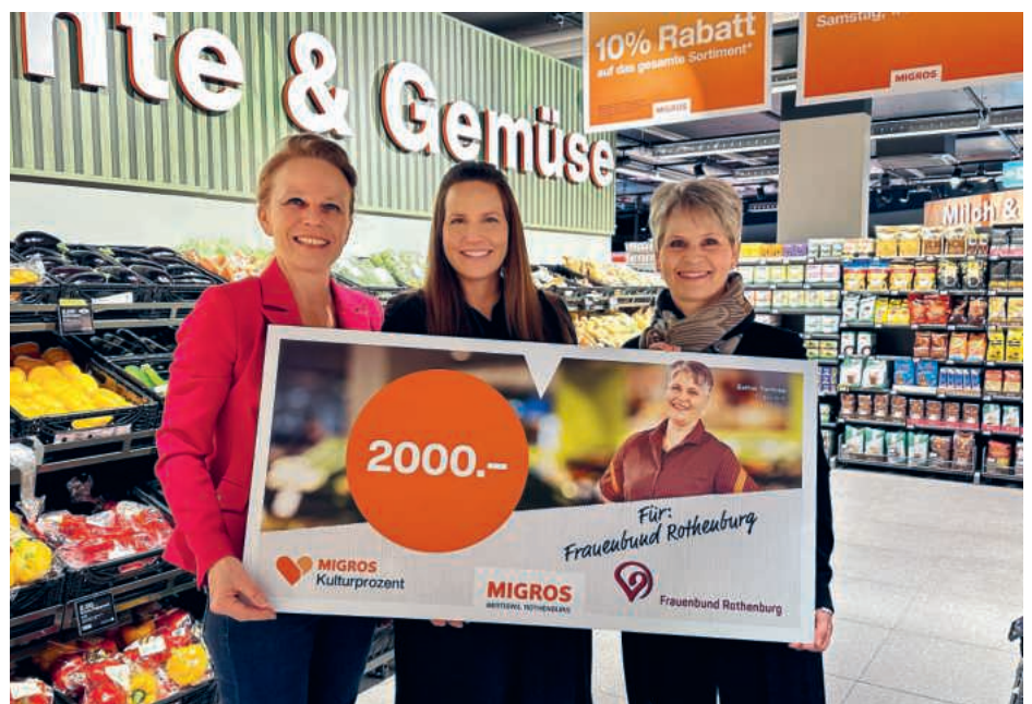
Anlässlich der Neueröffnung der Filiale in Bertiswil erhielt der Frauenbund einen Check aus dem Migros Kulturprozent.