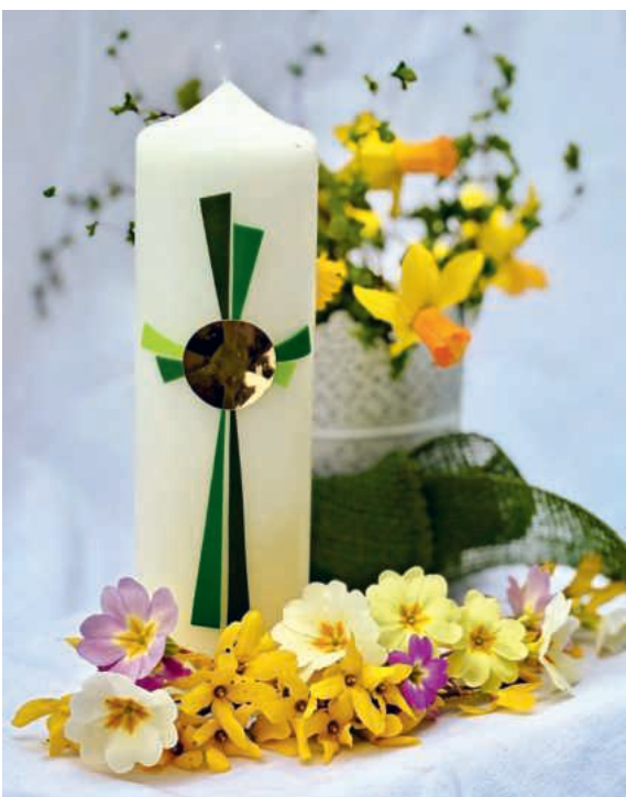
Die diesjährige Osterkerze von St. Mauritius und St. Maria ist in Grün und Gold gehalten.

Grün ist die Farbe der Natur und der Frische. Sie steht für den Frühling. Zusammen mit Gold, der Farbe des Lichts, bringt er neues Leben.