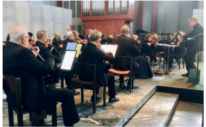
Das Orchester Emmen lädt zum Konzert ein.