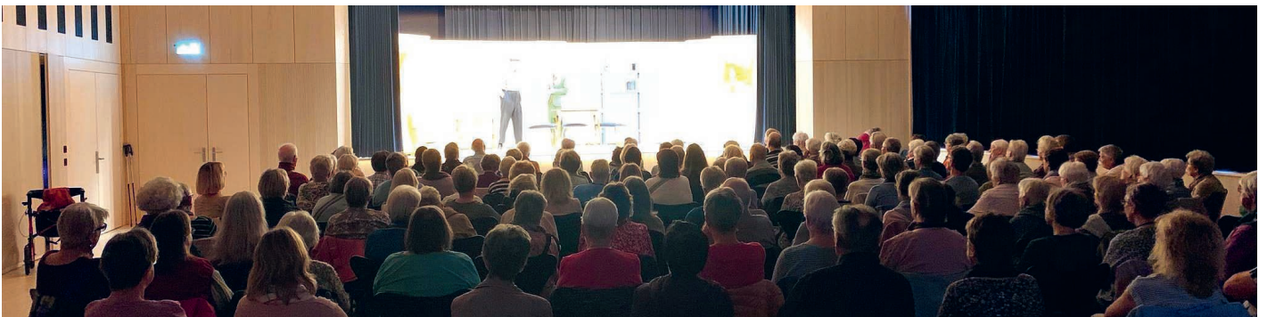
Das Wandertheater war erstmals im neuen Pfarreisaal Gerliswil zu Gast.