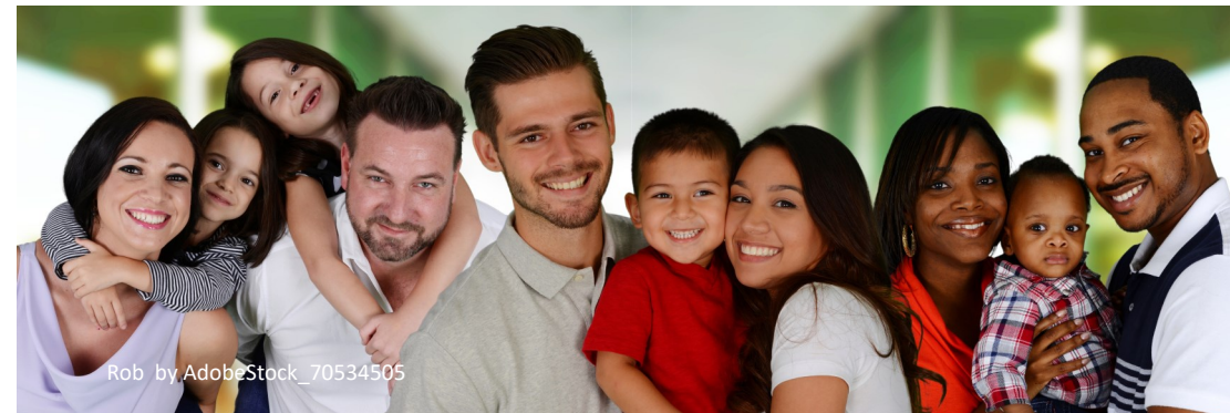
Rob by AdobeStock_70534505