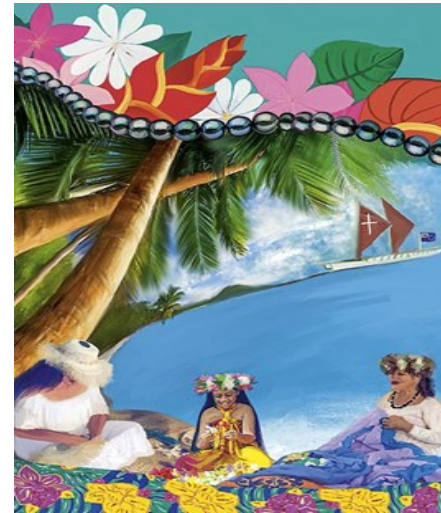
Bild: Wonderfully Made“ von den Künstlerinnen Tarani Napa und Tevairangi Napa