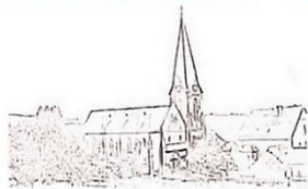
St. Antonius Maßweiler