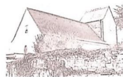
Mariä Himmelfahrt Nünschweiler