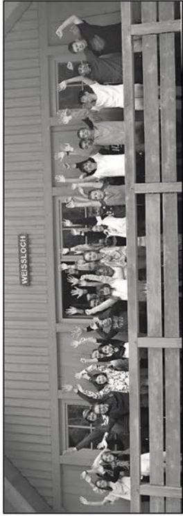
Minifreizeit 2024 im Schwarzwald