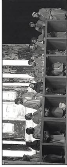
Passionsspiel Sömmersdorf 2024