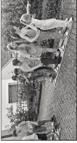
Elztäler Ministrantenfest 2024