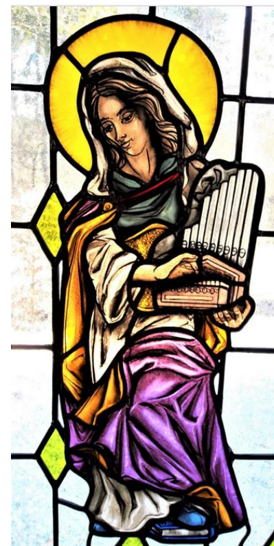
Hl. Cäcilia, Schutzpatronin der Kirchenmusik