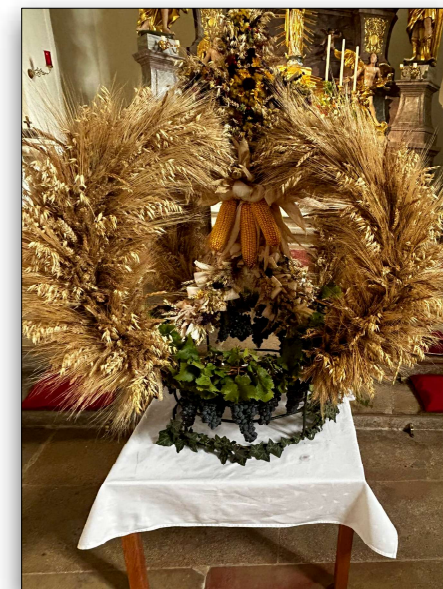
Danke für die kunstvolle Erntekrone!

6.00 Rosenkranz mit eucharistischem Segen 11.00 Beginn des Bauernmarktes 17.45 Rosenkranz 18.30 Vorabendmesse mit Adventkranzsegnung