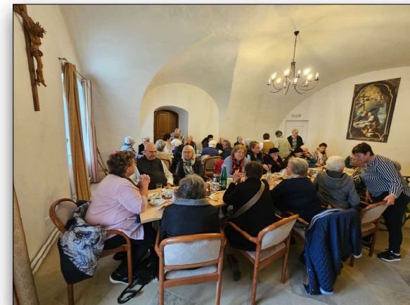
Jause nach der Krankenmesse