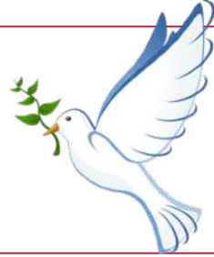
Abbildung nur in der Druckversion!