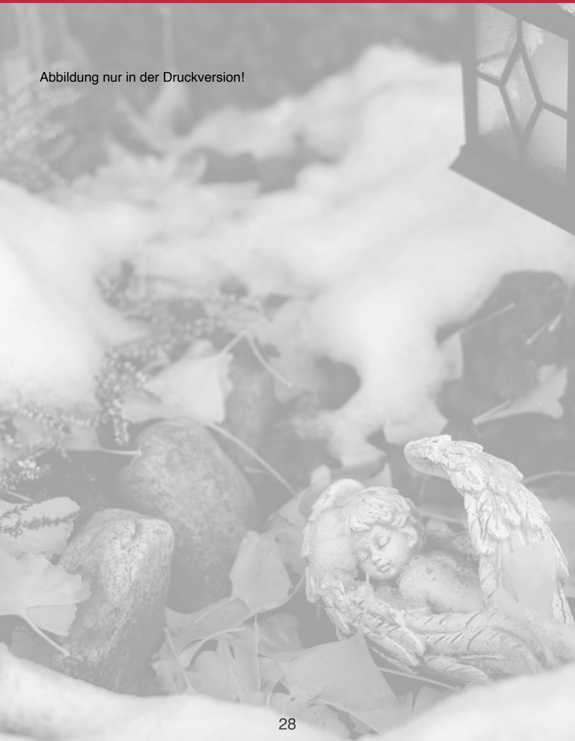
Abbildung nur in der Druckversion!