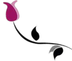
Abbildung nur in der Druckversion!