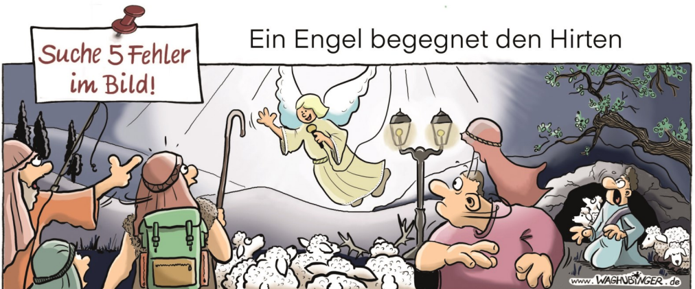
Engel, Schutranzen, Mikrofon, Laterne, Geweih, Mikroskop