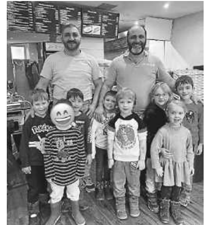
Besuch bei „Mr. Kebap“

Hier durften sie nicht nur hinter die Kulissen schauen, sondern sich auch noch selbst eine Pizza zubereiten. Mit viel Spaß wurde der Teig ausgerollt, die Soße verstrichen und mit allerlei Leckerem belegt. Diese wurden dann im Anschluss gemeinsam in der Kita verspeist.