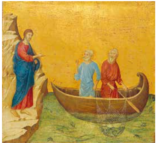
Ruf der Apostel Petrus und Andreas, Duccio di Buoninsegna