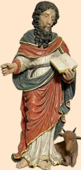
Statue des Hl. Lukas Atelier Greeff ehem. Kapelle Eisenborn, heute Parzenter Junglinster