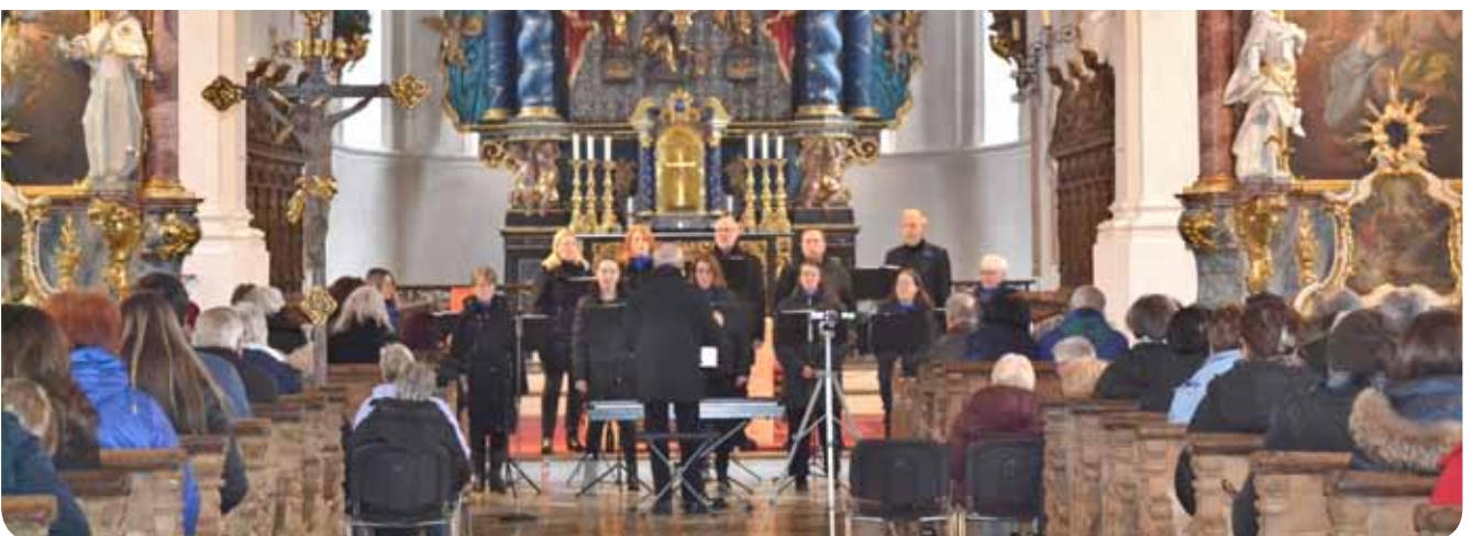
Ein musikalisches Feuerwerk erlebten die Besucher beim Konzert von MixDur in der Wallfahrtskirche St. Michael in Violau und dankten mit minutenlangen Standing Ovations.