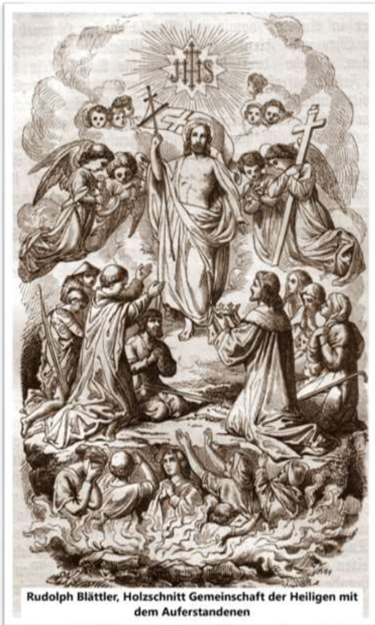
Rudolph Blättler, Holzschnitt Gemeinschaft der Heiligen mit dem Auferstandenen