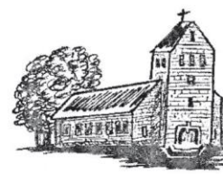
Hüven St. Bonifatius