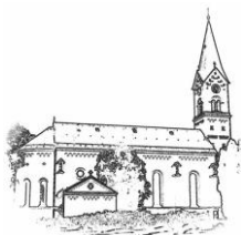
St. Nikolaus (St.N.)