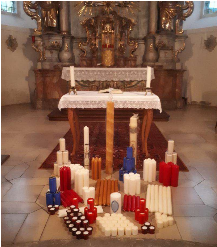
Kerzensegnung St. Laurentius Eschenbach