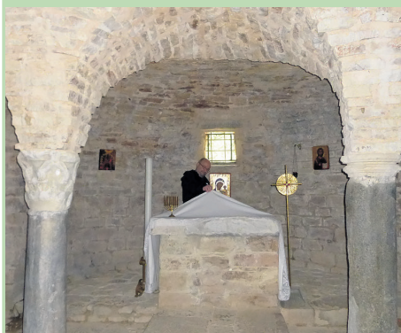
Unerwartetes mitten auf dem Pilger-Weg