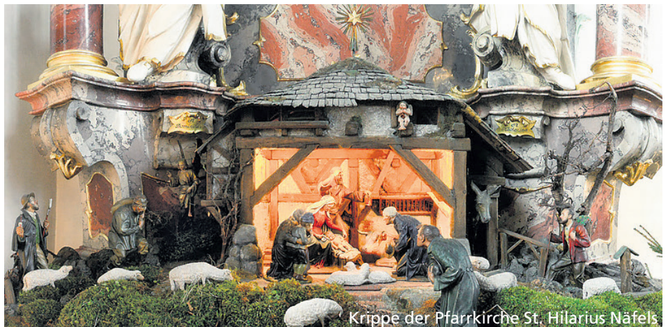
Krippe der Pfarrkirche St. Hilarius Näfels

Geburt ausging, wünschen wir auch Euch und Euren Familien für das neue Jahr 2025! Frohe Weihnachten Eure Seelsorger