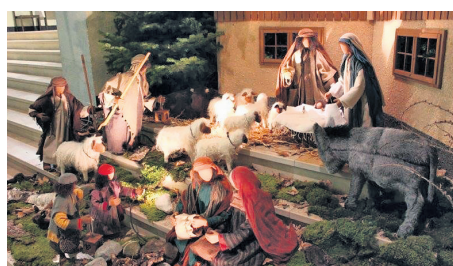
Krippe Derikönigskirche Netstal