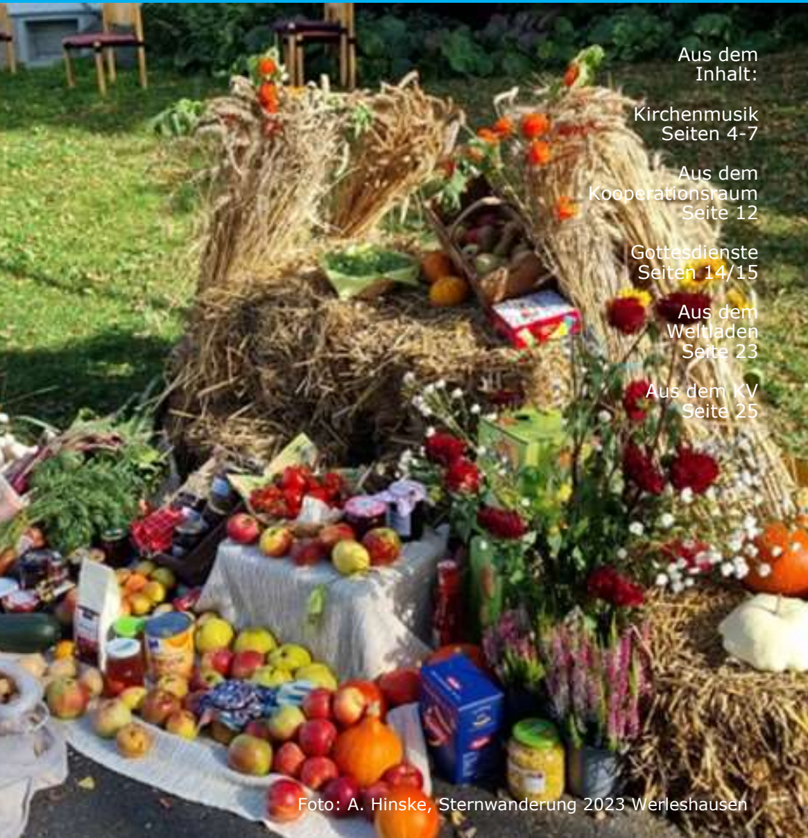
Sternwanderung 2023 Werleshausen