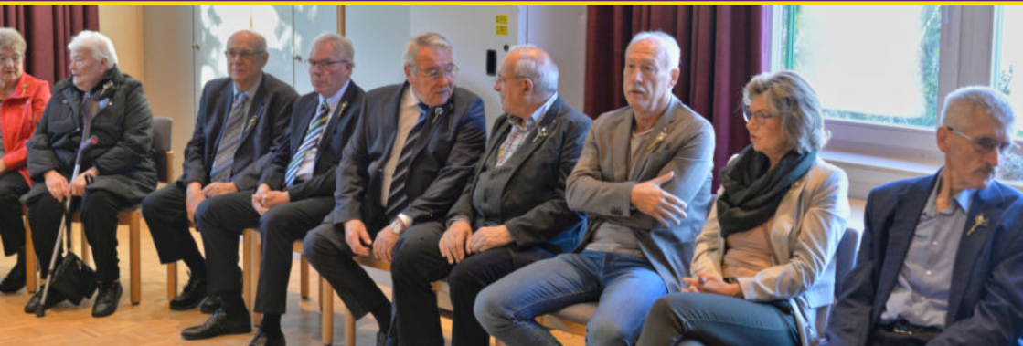
Jubelkonfirmation 2024