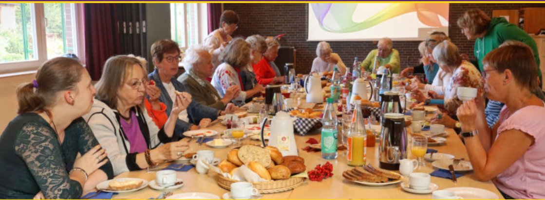
↓ Männerkreis besichtigt das Stift Fischbeck