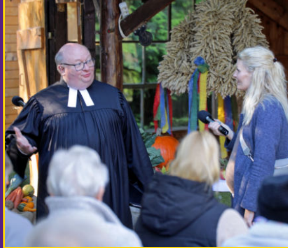
Erntedank-Gottesdienst in Dörpe