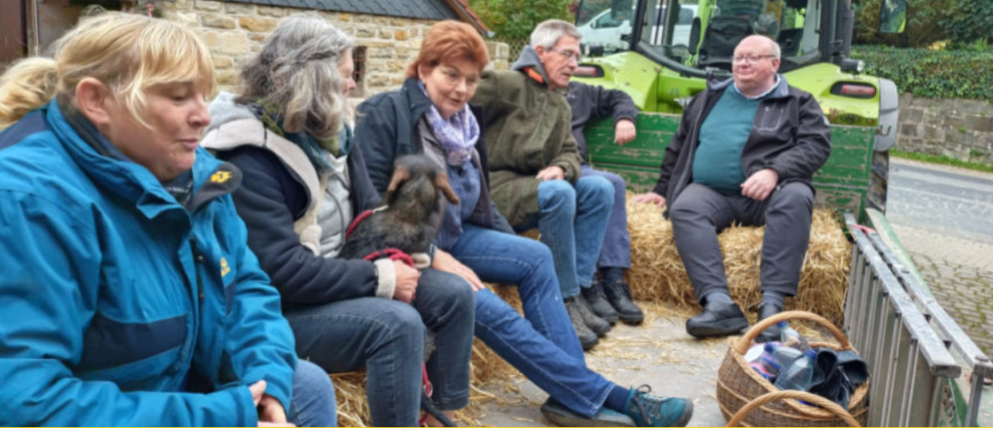
↑ KV-Ausflug in die Feldmark / Frauenfrühstück ↓