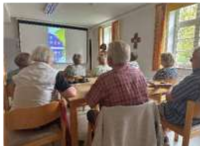
Lerntreff am 15.07.24 im Alten Pfarrhaus