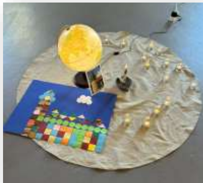
Foto zum KU 4 zur Einheit „Kirche“ – das Haus der lebendigen Steine

Die Treffen für den sogenannten Vorkonfirmandenunterricht, KU 4, sollen stattfinden. Wer ein Kind in der 4. Klasse hat, das daran teilnehmen möchte, melde sich ganz schnell noch im Gemeindebüro an.