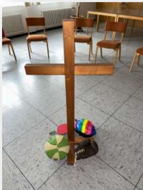
Foto: „Olympisches Stilleben“ (gestaltete Mitte für Elterntreffen des KU 8-Jahrganges)

Der Abendmahlsgottesdienst zur Konfirmation findet am Sonnabend, 24. Mai 2025, um 17 Uhr und der Konfirmationsgottesdienst am Sonntag, 25. Mai 2025, um 10 Uhr statt.