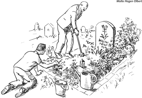
Malte Hagen Olbertz

Zum Fest Allerheiligen findet wieder die traditionelle Gräbersegnung statt: