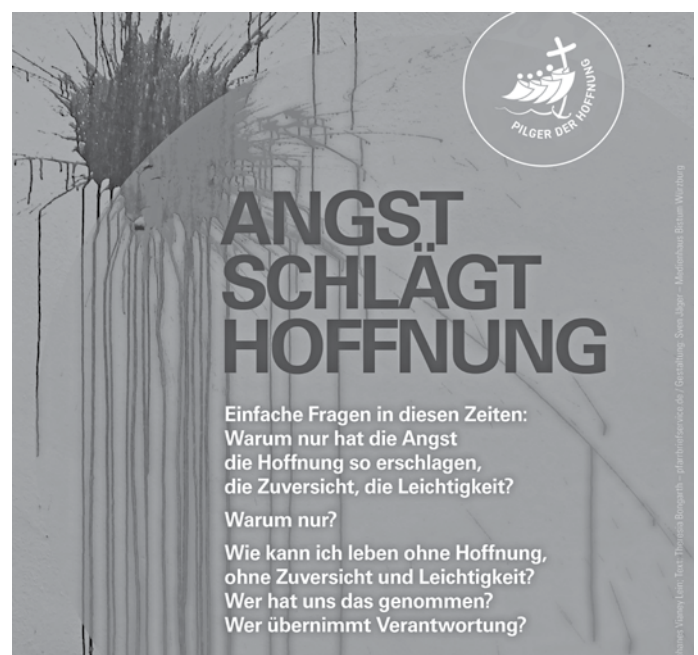
Bild: Bild: Yohanes Vianey Lein, Text: Theresia Bongarth, Layout: Sven Jäger – Medienhaus Bistum Würzburg, In: Pfarrbriefservice.de, In: Pfarrbriefservice.de

Rosenkranz: In Heilig Kreuz, Montag bis Samstag um 17 Uhr.