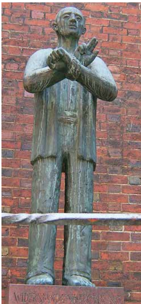
Foto: Statue Bonhoeffer – Erklärung zum Bild: Bonhoeffer-Statue von Fritz Fleer (1979) an der Hauptkirche Sankt Petri (Hamburg)

Als hochgeschätzter protestantischer Theologe erkannte Dietrich Bonhoeffer sehr früh die Gefahren des Nationalsozialismus. Er unterstützte die Bekennende Kirche, die öffentlich machte, dass der christliche Glaube nicht mit dem menschenverachtenden Bild der Nazis vereinbar war. Bonhoeffer bekam auf einer Reise in die USA das Angebot, dort zu bleiben und deutsche Flüchtlinge zu betreuen, doch er kehrte 1938 bewusst in sein Heimatland zurück, wohl wissend um die Gefahren, die ihm hier drohten. Tatsächlich wurde er 1943 verhaftet und galt nach dem Stauffenberg-Attentat als persönlicher Gefangener Hitlers, dem nach dem Endsieg ein großer Schauprozess gemacht werden sollte. Auf den persönlichen Befehl Hitlers hin wurde er noch kurz vor dem Zusammenbruch des 3. Reiches hingerichtet. Seine letzten überlieferten Worte gingen an einen englischen Mitgefangenen, der einem befreundeten Bischof in England folgendes ausrichten sollte: „Sagen Sie ihm, sagte er, dass dies für mich das Ende, aber auch der Anfang ist. Mit ihm glaube ich an das Prinzip unserer universellen christlichen Brüderlichkeit, die über alle nationalen Interessen hinausgeht, und dass unser Sieg sicher ist.“