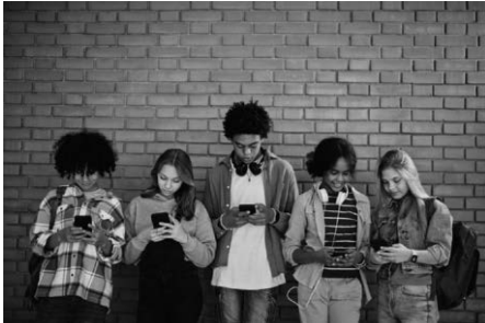
Plattformen wie Instagram, TikTok und Snapchat gehören für viele Kinder und Jugendliche zum Alltag.

wind für Familien“ wird über die Risiken von Sexting referieren und aufzeigen, wie dieses sensible Thema mit Kindern thematisiert werden kann. Im Anschluss besteht die Möglichkeit, Fragen zu stellen. Eine Anmeldung zum Vortrag ist unter www.bodenseekreis.de/kkp-bodenseekreis über den Reiter „Veranstaltungen“ möglich. Die Pubertät stellt nicht nur Jugendliche vor große Herausforderungen, sondern auch Eltern, die sich schrittweise auf die veränderte Lebenssituation einstellen müssen. Denn Plattformen wie Instagram, TikTok und Snapchat gehören für viele Kinder und Jugendliche zum Alltag. Medien bieten im Rahmen der sexuellen Identitätsentwicklung zwar vielfältige positive Nutzungsmöglichkeiten, bergen jedoch auch Risiken, insbesondere im Bereich der sexualitätsbezogenen Mediennutzung. Veranstaltet wird der Vortrag vom Landratsamt Bodenseekreis, der Kommunalen Kriminalprävention Bodenseekreis e. V. und dem Polizeipräsidium Ravensburg.