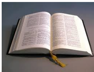
Ein stärkendes Wort aus der Bibel