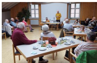
Eine fröhliche Gemeinschaft