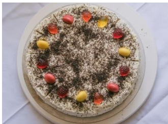
Von Meisterhand gezauberte Torten