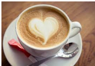
Mit Liebe gebrühter Kaffee