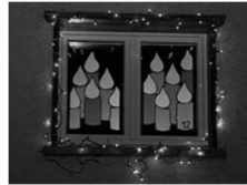
Vorfreude auf Weihnachten

Termin: Sonntag, 15.12. um 17.00 Uhr vor dem Pfarrheim, Wilhelmstr. Der Pfarrgemeinderat und Kirchenvorstand laden herzlich ein.