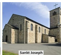
Marburger Str. 87