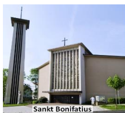
Ihringshäuser Str. 3

Ukrainehilfe der Malteser Kassel : Marburger Str. 87, Tel: 0561 - 8619142