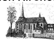
St. Laurentius Gieboldehausen