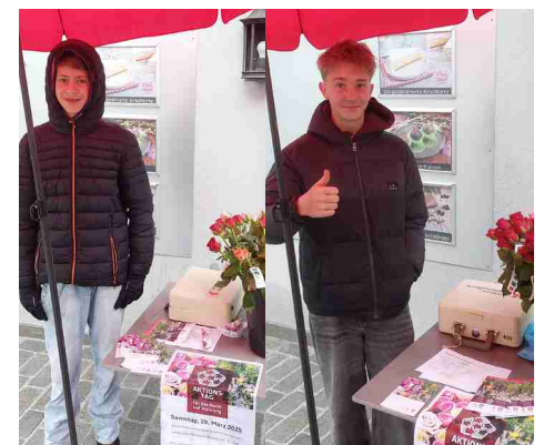
Die Rosenverkäufer vor der Bäckerei Chilestätgli