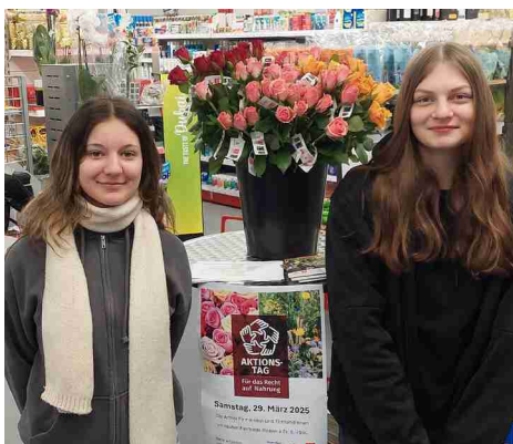
Die Rosenverkäuferinnen im SPAR