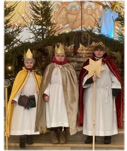
Sternsinger Wiesbaum - Mirbach