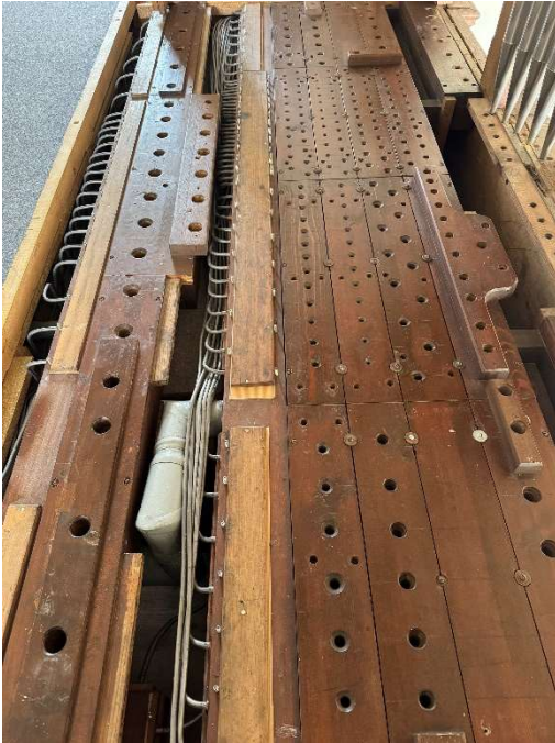
Boden der Pfeifen mit den Rohren