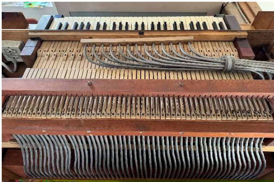
Spieltisch von vorne mit den Rohren für die pneumatische Steuerung